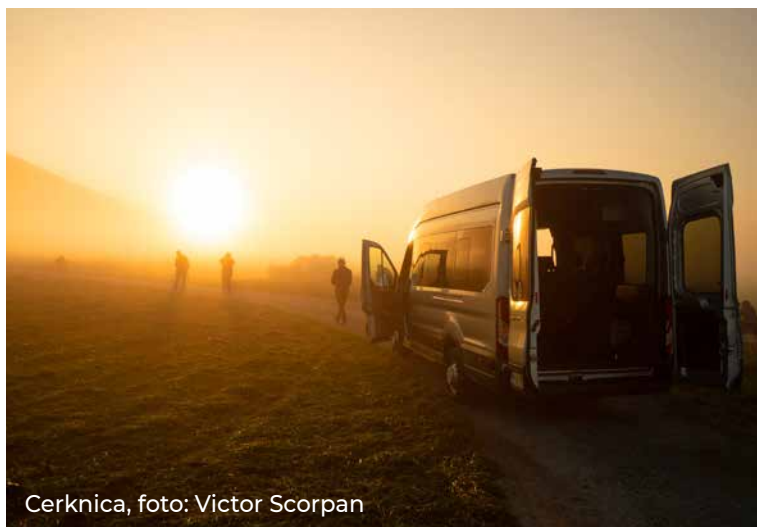
Cerknica, foto: Victor Scorpan

Zaradi čudovite svetlobe se ustavimo na „kar enem polju“ in naredimo nekaj posnetkov. No, nekateri so vzeli to fotkanje zelo resno in kar predolgo smo se zadržali, zato nam je meglica iznad Cerkniškega polja skoraj ušla. Pa kdaj drugič, kajti namenjeni smo v Buje, Grožnjan in Motovun.