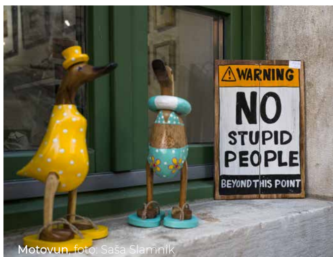
Motovun, foto: Saša Slamnik