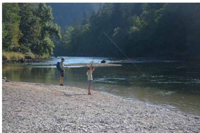
Vilko Koren, 3. nagrada Pod Fuxovo brvjo