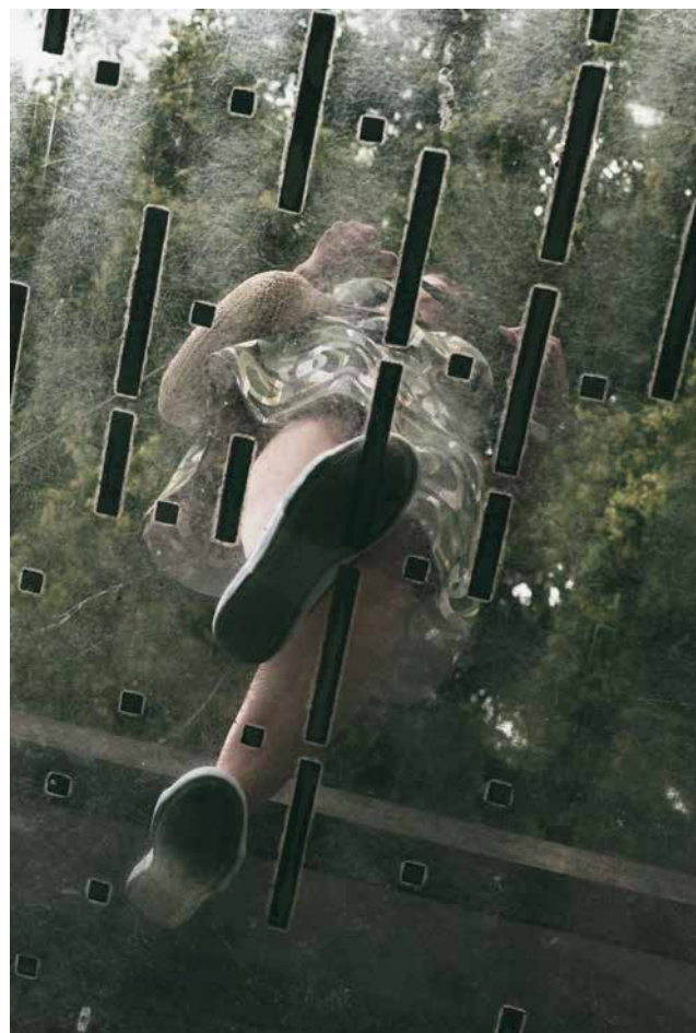
Saša Slamnik, diploma V ZELENEM