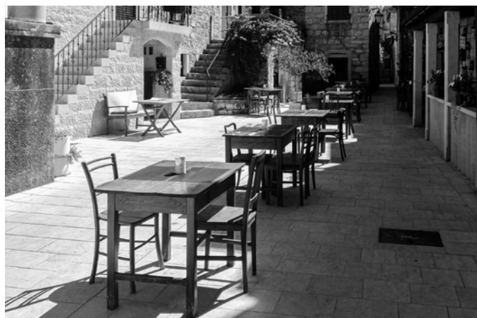
Anica Šolar, diploma RESTAVRACIJA SREDI ULICE