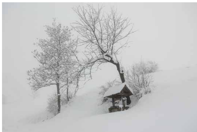
Jasim Suljanović, 2. nagrada Ob poti