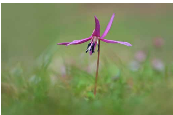
Drago Vogrinec, 2. nagrada PASJI ZOB