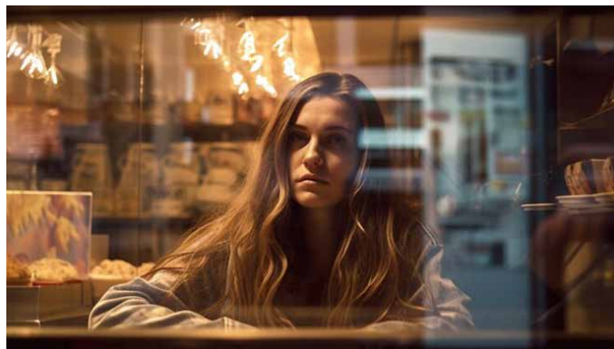
Primer AI slike, ki je bila ustvarjena na podlagi fotografij, ki so shranjene na spletu. Popolno!

Še vedno pa rad v roke vzamem analogni fotoaparati in potem nestrpnost čakam na razvite negative.