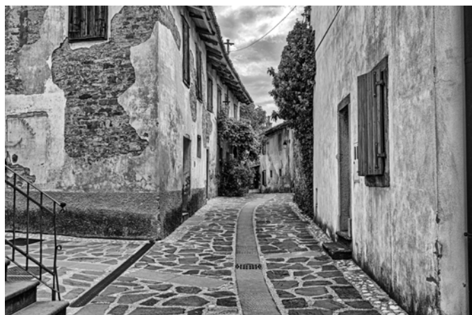
Simon Senica, diploma STREET