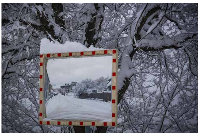
Žarko Petrovič, 3. nagrada CESTNO OGLEDALO