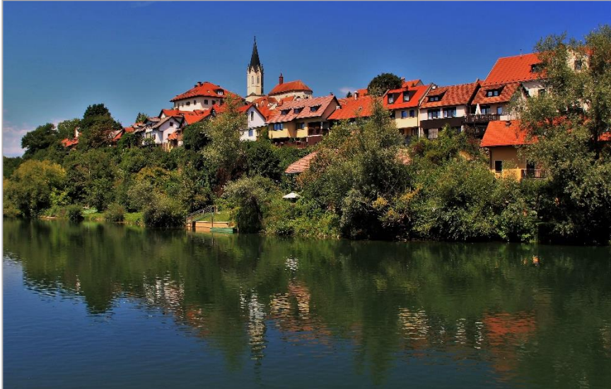
Novo mesto se ogleduje v Krki.