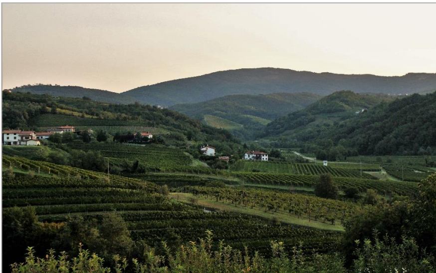
Goriška Brda se prebujajo.