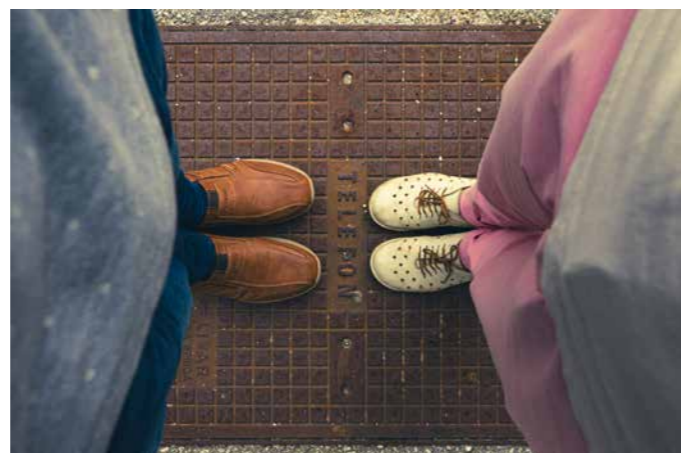
Victor Scorpan, diploma TELEFON