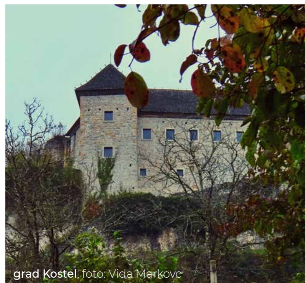
grad Kostel

V Kočevski Reki so nas pričakali policisti na usposabljanju s puškami naperjenimi proti nam in vodnik Stane, ki nas je popeljal po najlepših kotičkih dežele Petra Klepca. Na gradu Kostel nam je grajska vodnica predstavila grad in etnološko zbirko Sledi časa, ki predstavlja življenje Kostelcev nekoč. Druga postaja je bil potok Nežica. Izvira pod vasjo Tišenpolj in se v slapovih čez lehnjakove pregrade spušča v dolino. Največji slap je na ogled kar z glavne ceste, ki vodi iz Kočevja proti Hrvaški.