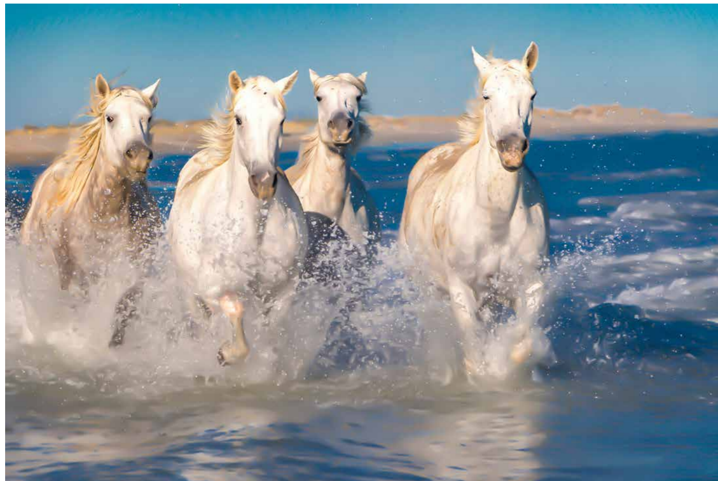
Jasim Suljanović, 1. nagrada V MORJU