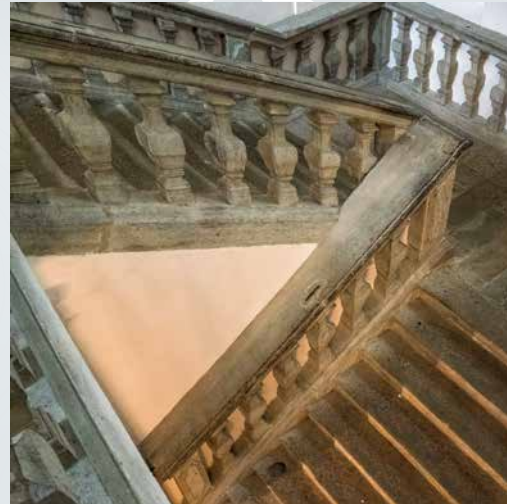
Saša Slamnik, 1. nagrada Graččina, stopnišče 1