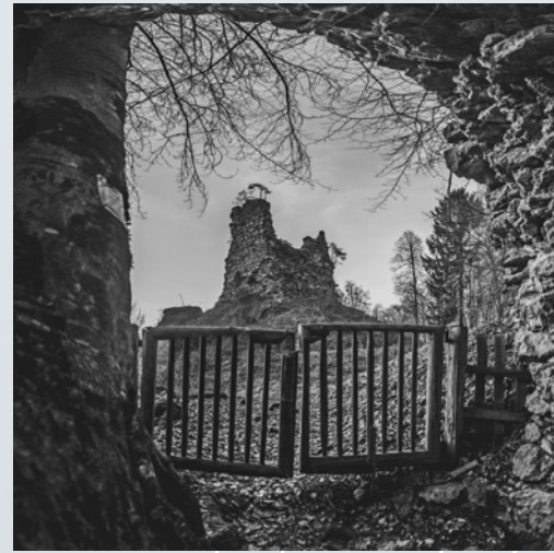
Tevž Smolnikar, 2. nagrada Pusti grad