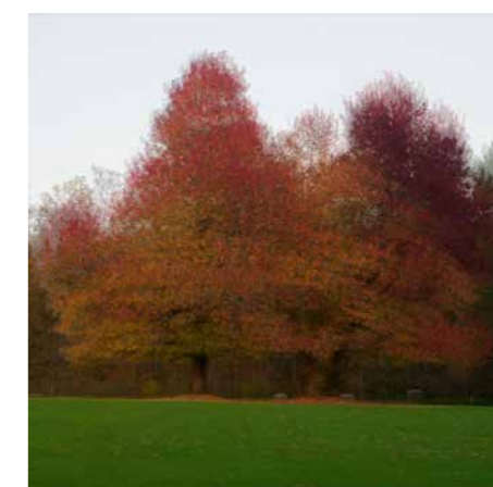
Victor Scorpan, diploma OBJEM