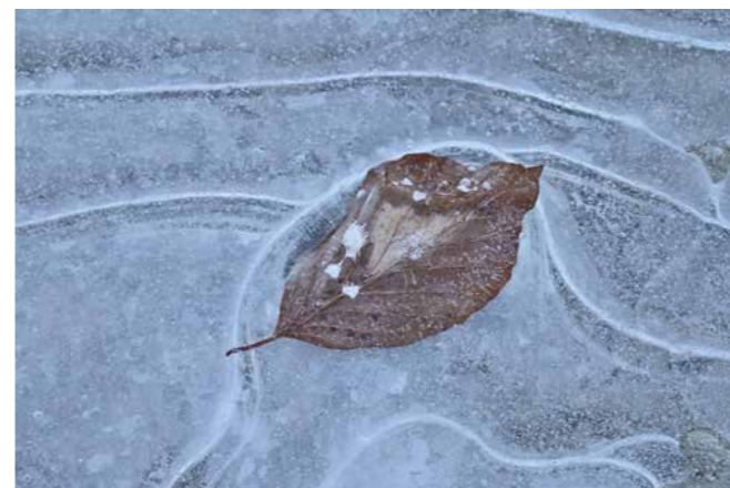
Drago Vogrinec, 2. nagrada LIST V LEDU