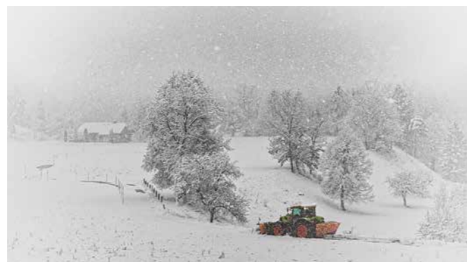
Žarko Petrovič, 3. nagrada PLUŽENJE