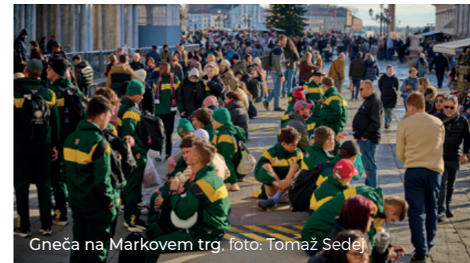
Gneča na Markovem trg, foto: Tomaž Sedej