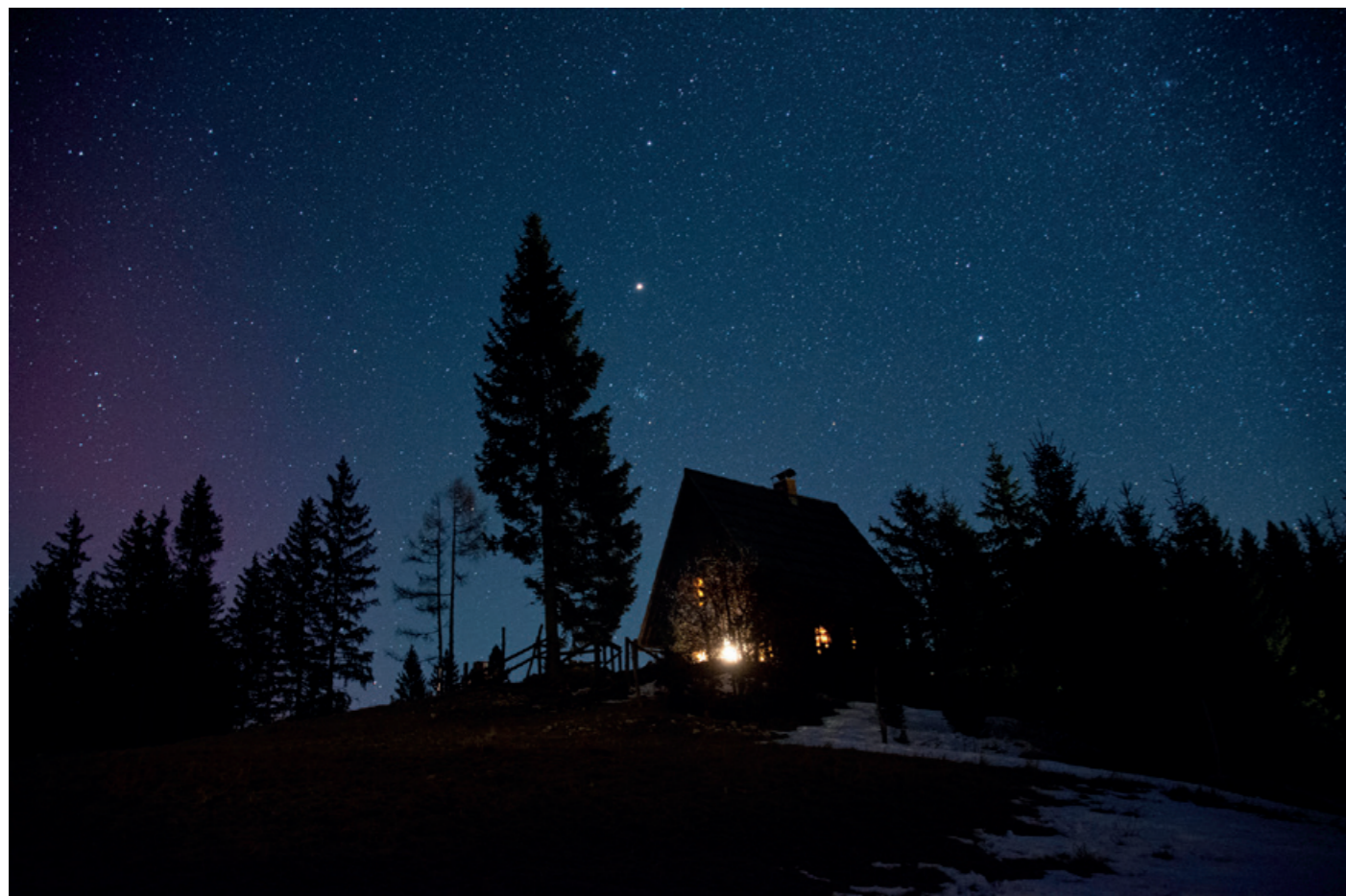
Simon Senica, 1. nagrada SEVERNI SIJ