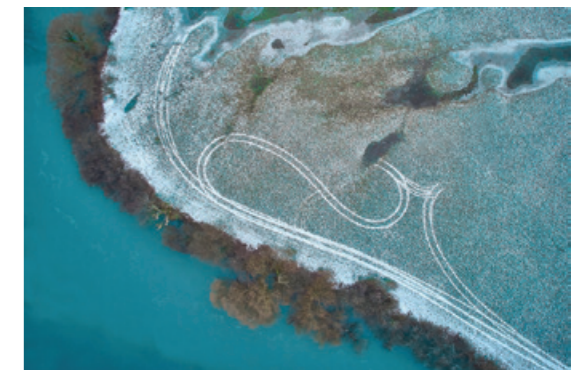
Tomaž Sedej, diploma SLEDI