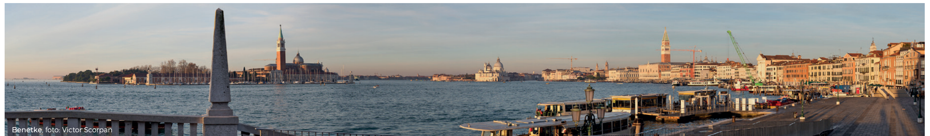
Benetke, foto: Victor Scorpan

Objavljanje naših razstav v koledarju dogodkov Deželnih novic, Gorenjskega glasu, Turizma Radol'ca in Moje Občine Radovljica ter na našem FACEBOOK-ku.