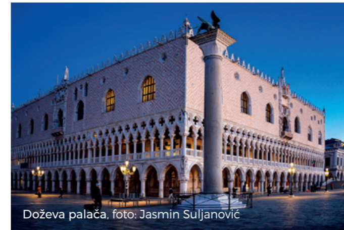
Doževa palača