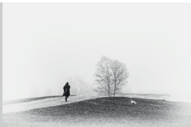
Žarko Petrovič, 3. nagrada NA SPREHODU