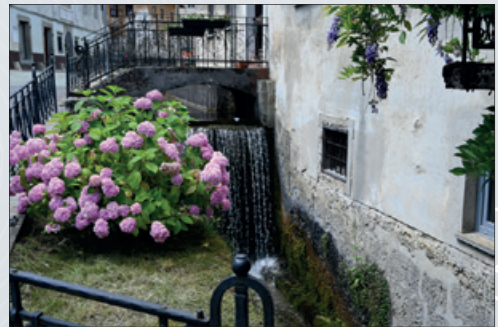
Marijan Ješe, 2. nagrada Kropa - delovna voda