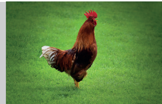
Drago Vogrinec, 3. nagrada PETELIN