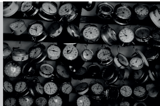
Tomaž Sedej, 2. nagrada VEKARCE