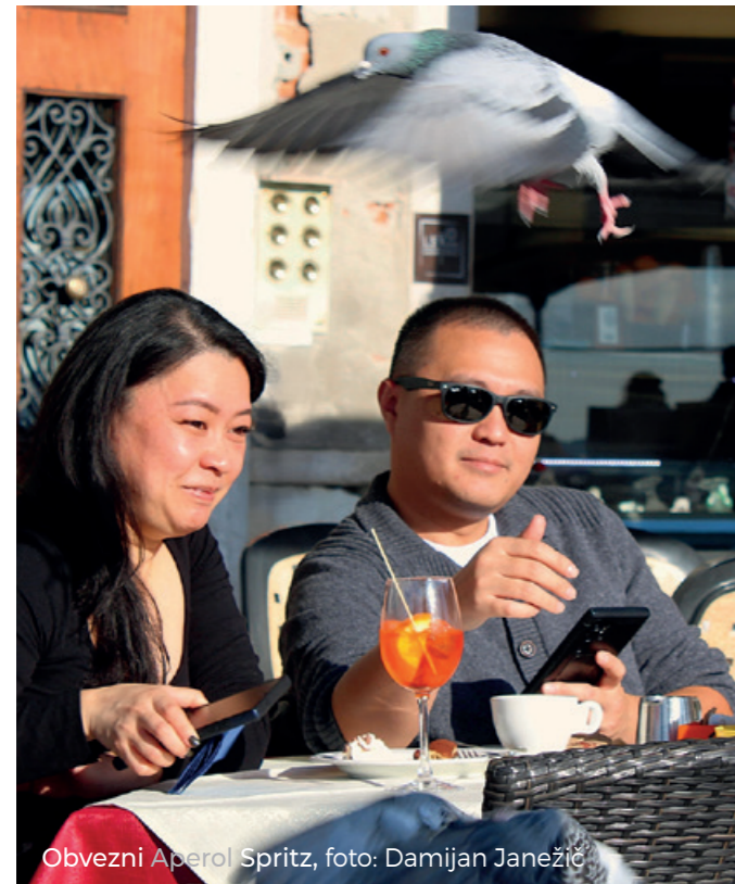
Obvezni Aperol Spritz, foto: Damijan Janežič

Praznično okrašene ulice, živahni trgi, odsevi lučk v kanalih ter razgibana arhitektura so ponujali obilico fotografskih izzivov: od širokih vedut do intimnih detajlov. V množici turistov ni bilo vedno lahko najti mirnega kadra, poleg tega pa smo morali biti zaradi dejavnih žeparjev ves čas pozorni na svojo fotografsko opremo in osebne stvari, kar nas vseeno ni odvrnilo od osredotočenega fotografiranja.