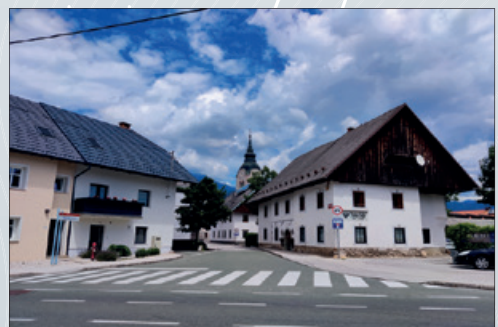
Staša Čelik Janša, 3. nagrada Lesce, Staro vaško jedro Lesce