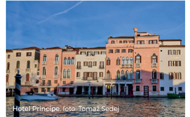
Hotel Principe